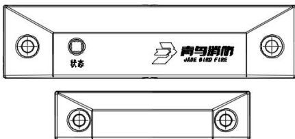
图 2 JBF62D-32P 安装示意图