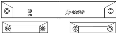
图 1 JBF62D-33P 安装示意图