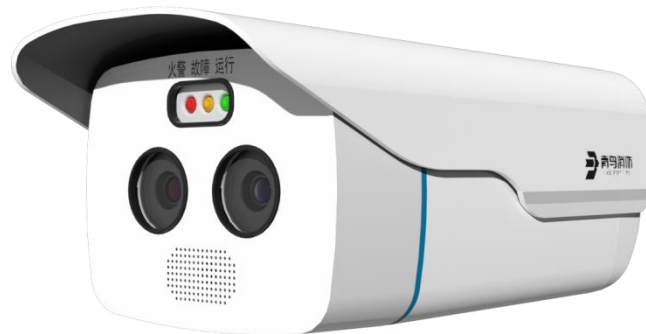
图像型火灾探测器探测部分