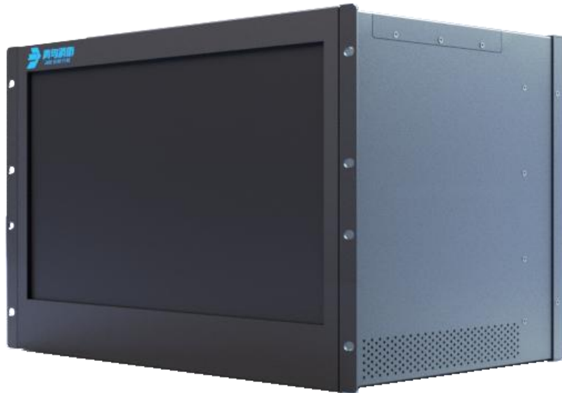
图像型火灾探测器监控部分

本次发布 VFD / SF-JBF-DG04、VFD / SF-JBF-DG08 监控部分同时也进行了更新。监控部分采用一体式入柜结构，占用 7U 面板空间，可灵活安装于单琴台或标准服务器机柜中。